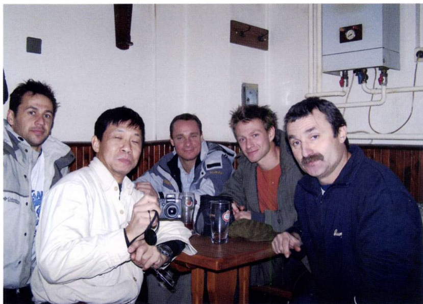
RÖMINÉL, 2007. SZILVESZTER NAPJA