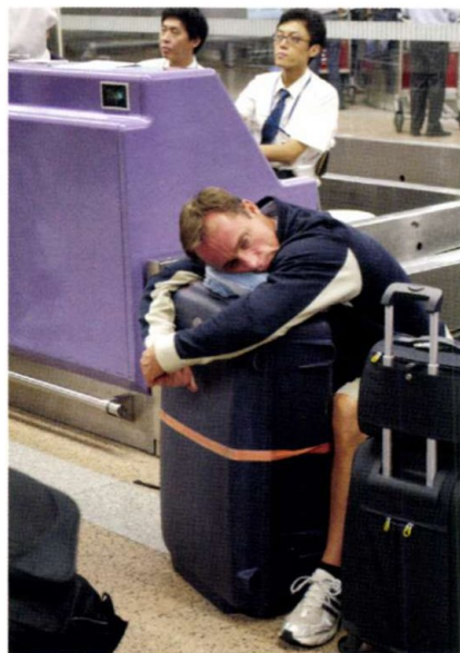
HOSSZÚ AZ ÚT