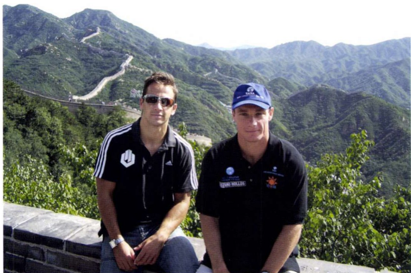
ONE WORLD, ONE DREAM