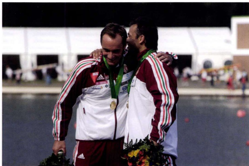
MOST MINDEN JÓ